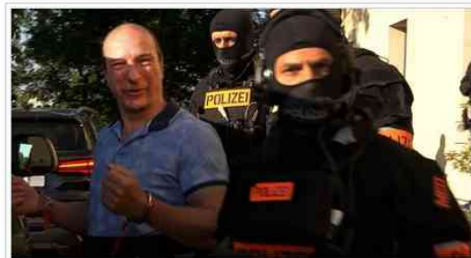
Verhaftung am 13. Mai 2025

Die Neue Deutsche Mark ist nach ihrer Einführung die gesetzliche Währung Deutschlands. Bis zur Einführung der